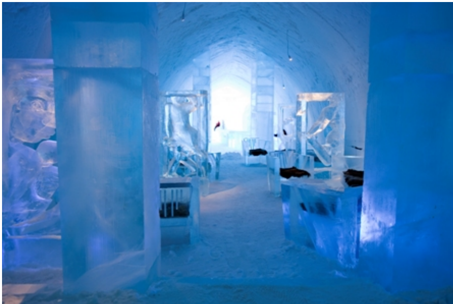
ABSOLUT ICEBAR JUKKASJÄRVI. Artists: Lena Kröbber & Mark Armstrong

Ontbijt gevolgd door treinrit van Luleå naar de mijnstad Kiruna (ongeveer 3u30). Dit traject zal niet snel vervelen want de prachtige sneeuwlandschappen, eindeloze bossen en uitzichten op het hooggebergte rijgen zich in snel tempo aan elkaar. Geregeld houdt de trein even halt in onooglijk kleine dorpjes met pittoreske stationnetjes. Aankomst in de vroege namiddag in Kiruna gevolgd door een transfer naar het wereldberoemde ijshotel van Jukkasjärvi. 's Avonds overnachting in het ijshotel. Je ontvangt een thermische slaapzak en een dikke muts alvorens naar je slaapkamer te gaan.