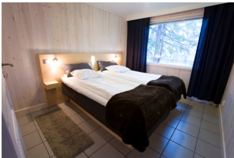
Nordic hotel chalet.

De tweede nacht verblijf je in een Nordic Hotel Chalet die ook wel warme accommodatie van het ijs hotel wordt genoemd. Ze zijn modern ingericht en beschikken over 2 slaapkamers waarvan 1 slaapkamer met dubbel bed en 1 slaapkamer met een stapelbed. Ze herbergen dus maximaal 4 personen.