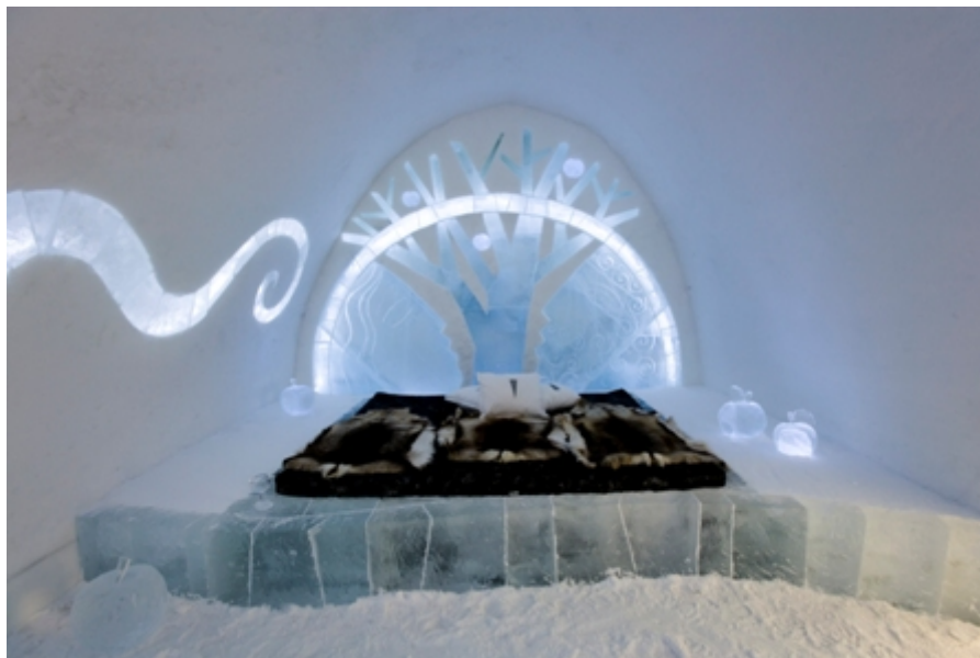
Artists: Natalia Chotyjewa & Karlo Ia.